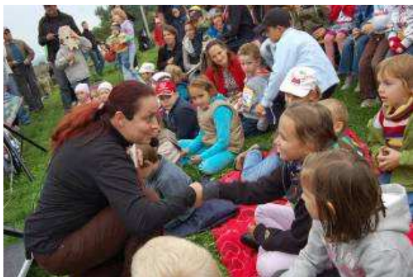
Programy na Šarkaniáde pod hradom Devín