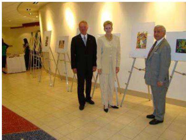
BIB v USA

Washington, USA (Palisades Neighborhood Library, 18. 10. – 30. 11. 2010)