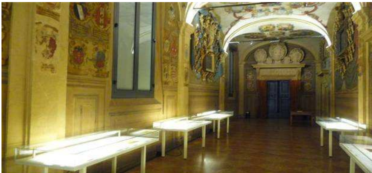
Výstava BIB v historickej knižnici Biblioteca Archiginnasio