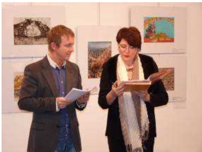
Viedeň, Rakúsko (Slovenský inštitút, 13. 1. – 16. 2. 2010)