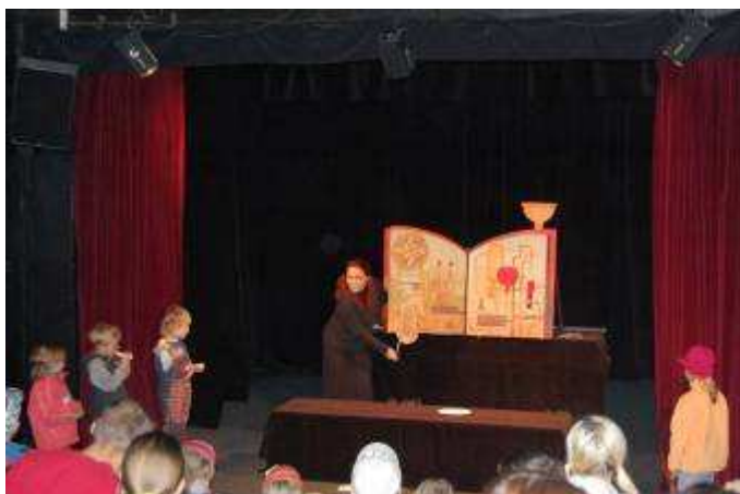
Na májových. Dračích slávnostiach v Trutnove v Českej republike