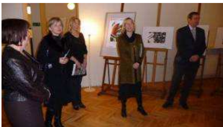
Varšava, Poľsko (Mestská knižnica, 25. 1. – 28. 2. 2010)