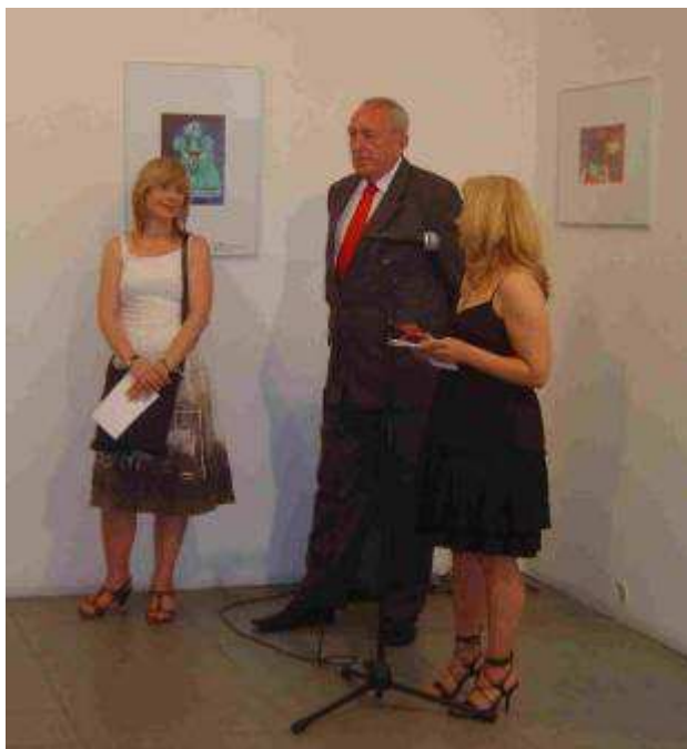
BIB v Prahe