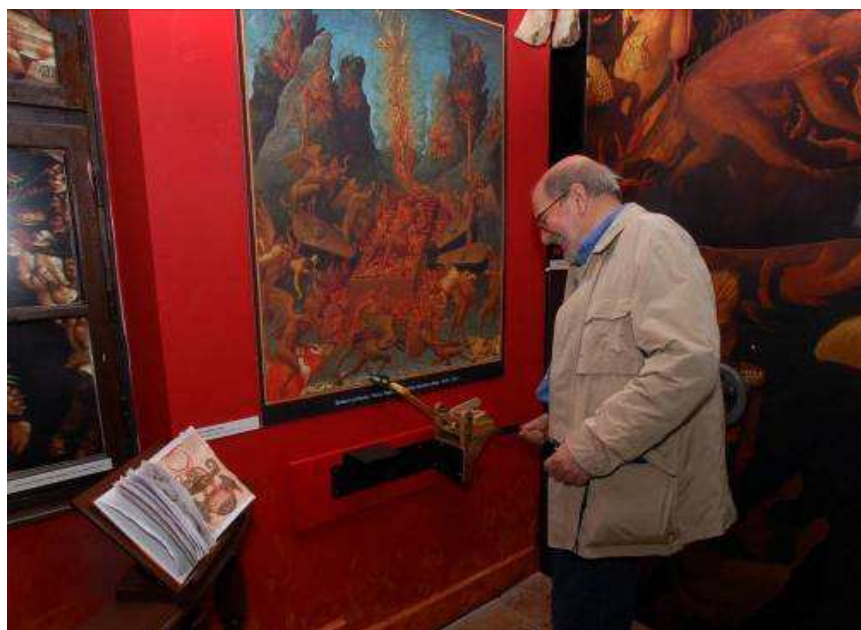
Guillermo Mordillo vo výstavách v BIBIANE

Pri svojej prvej návšteve Slovenska vo februári 2010 navštívil BIBIANU špičkový argentínsky grafik, ilustrátor a jeden z najznámejších karikaturistov a autorov krátkych animácií a filmov plných láskavého humoru Guillermo Mordillo . Pri prehliadke výstav o hre a o drakoch sa prejavil ako človek, ktorý si dokázal uchovať kreatívny a radostný pohľad na svet, aký mu väčšina z nás môže len závidieť.